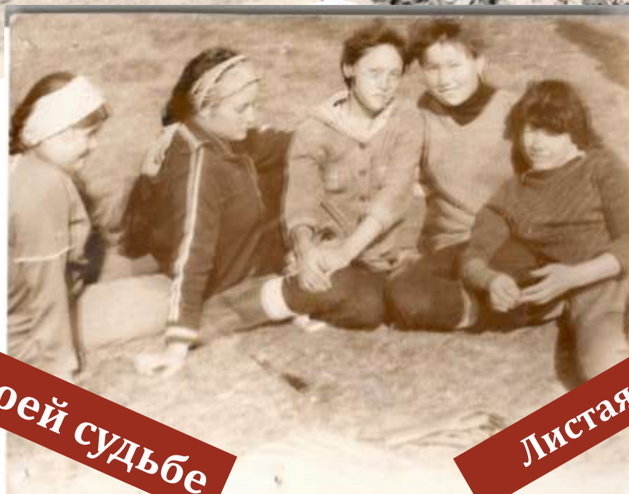
Комсомол в моей судьбе