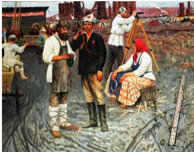
Строительство Магнитогорска. Комсомольская домна № 2.