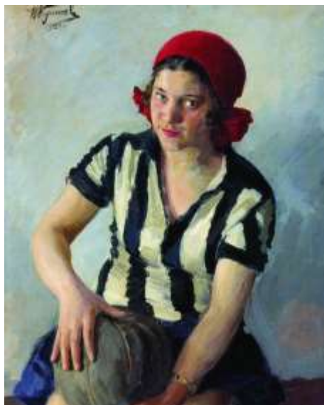
И. С. Куликов « Физкультурница» 1929г