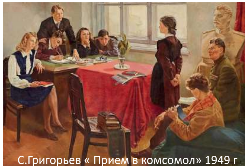
С.Григорьев « Прием в комсомол» 1949 г