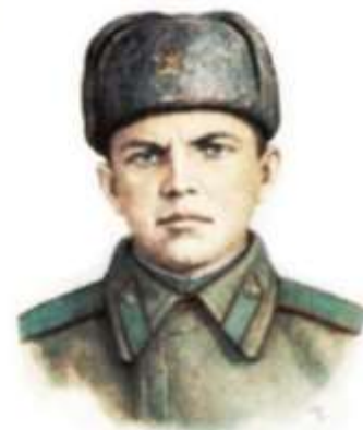
Александр Матросов 05.02.1924 г. – 27.02. 1943 г.