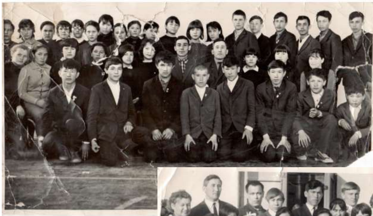
Выпуск 1971 года