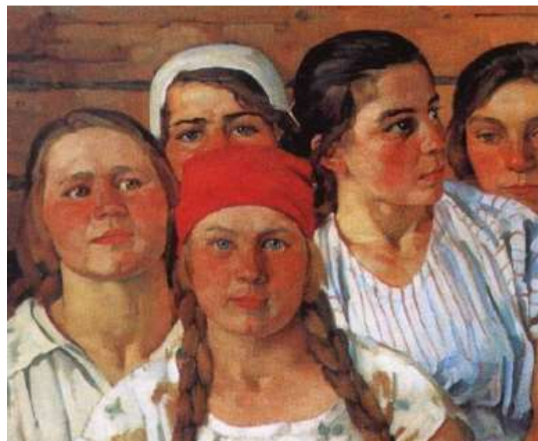
К.Ф. Юон « Комсомолки» 1926