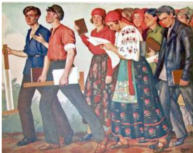
С.М.Прохоров. Рабфаковцы. 1928 год.