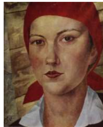
К. Петров-Водкин «Работница» 1925г